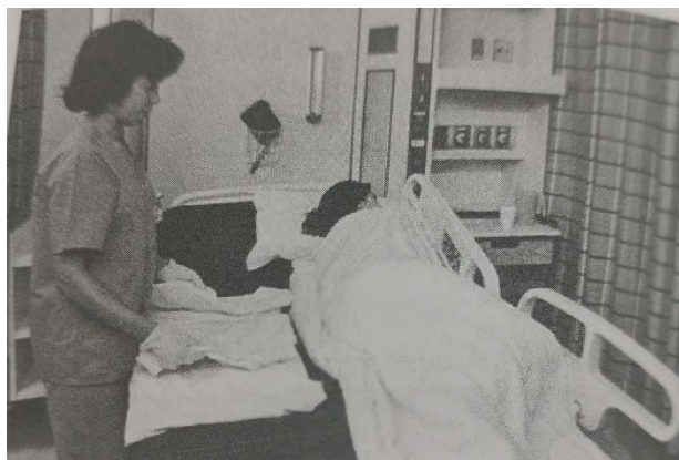
۲- نحوه قرار دادن ملافه بزرگ زیرین بر روی نیمه خالی تخت