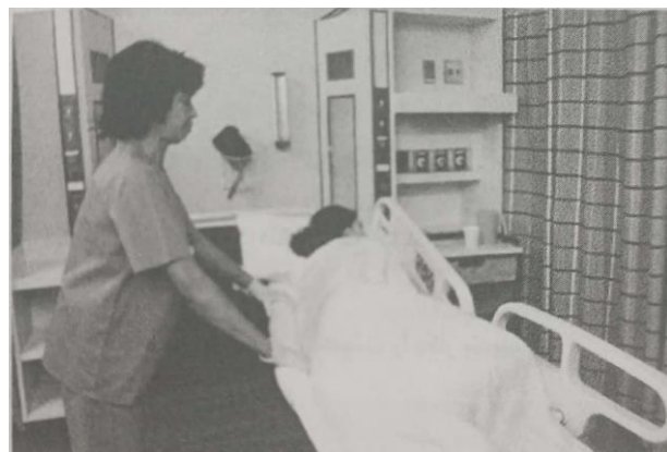
۱- تا کردن ملافه های کشیف به صورت بادبزنی تا نزدیک بدن بیمار